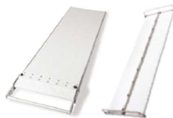
ABZIEHTÜCHER BELADER TÜCHER