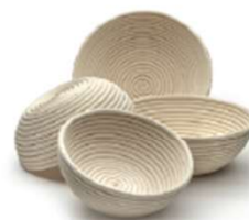
GÄRKÖBCHEN / BROTFORMEN AUS PEDDIGROHR