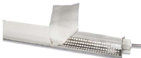
TRÖGELTÜCHER FÜR KIPPDIELEN / GÄRGEHÄNGE / GÄRSCHRÄNKE