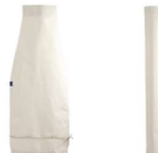
MEHLABLASSSCHLAUCH FILTERSACK / SILOSCHLAUCH