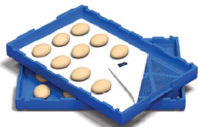
DIELN / BELAUGUNG / BERLINER / BAGUETTE TÜCHER