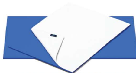
PEELBOARD GÄRTÜCHER SONDERANFERTIGUNGEN