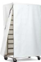
ABDECKUNG FÜR WAGEN / KNETER / KESSEL / BEHÄLTER & MASCHINEN