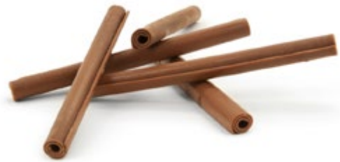
Milch | Art.Nr.: E0510