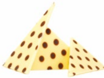
Punta | 55 x 35 mm | VPE: 490 St.