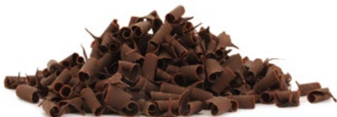
Dunkel | VPE: 2 kg | Art. Nr.: E0017

VPE: s. Artikel Größe: 9 x 5 mm Gewicht: s. Artikel