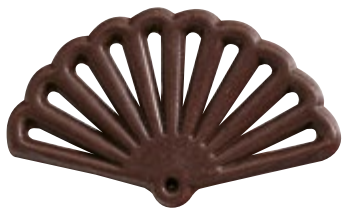
Schokoladenfächer oriental Zartbitter 59 mm | VPE: 400 St. | 0,925 kg Art. Nr.: E0085