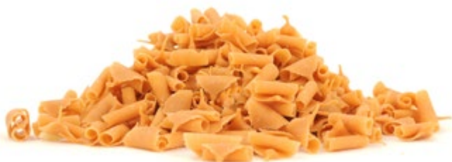
Karamel | VPE: 2,5 kg | Art. Nr.: E0009