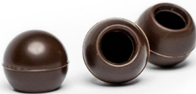
Zartbitter 56% Kakao Art. Nr.: CC-E1683