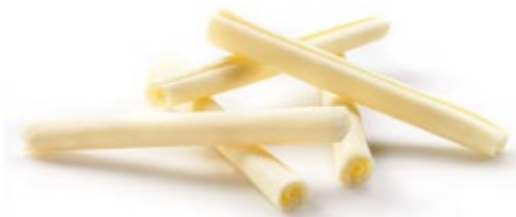
Weiß | Art.Nr.: E0511