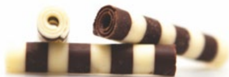
Zebra Four | VPE: 4 kg (ca. 40 mm) | Art.Nr.: E1238