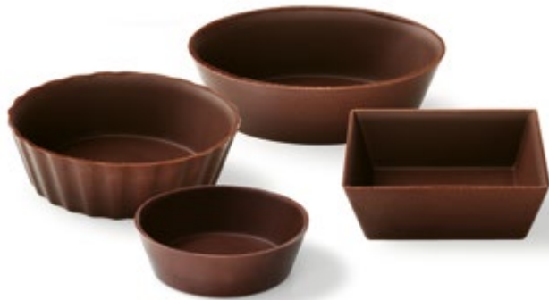
Petit Fours Set Zartbitter | 50 x 15 mm | VPE: 312 St. Art. Nr.: E0097