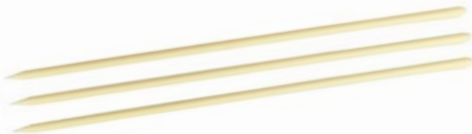
Weiß | Art.Nr.: E1542

VPE: 300 St. Größe: 200 x 4 mm Gewicht: 0,6 kg