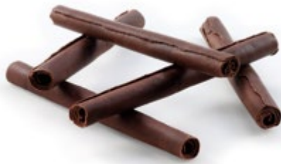
Dunkel | Art.Nr.: E0503

VPE: 150 St. Größe: 8,5 cm Gewicht: 0,6 kg