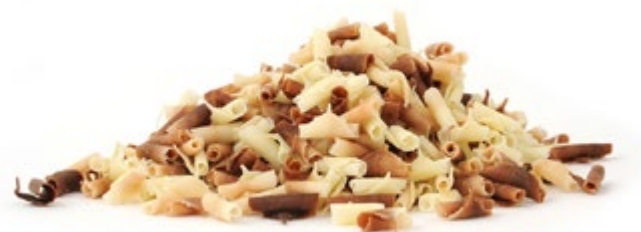
Duo | VPE: 4 kg | Art. Nr.: E0012