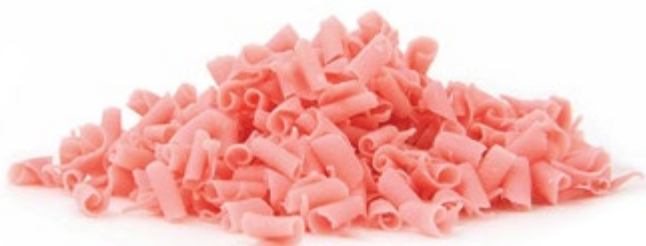
Erdbeere | VPE: 2,5 kg | Art. Nr.: E1961