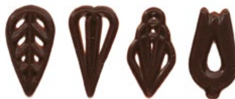
Soiree 4er Sortierung 40 mm | VPE: 610 St. | 0,460 kg Art. Nr.: E1377