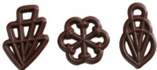
Filigran 3er Sortierung 45 mm | VPE: 300 St. | 0,360 kg Art. Nr.: E1712