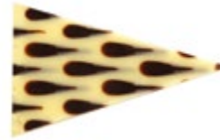
Lacrima | 55 x 35 mm | VPE: 490 St.