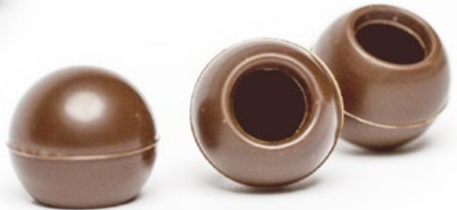
Vollmilch 35% Kakao Art. Nr.: CC-E1751