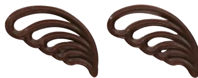
Schokoladenkämmchen Zartbitter 60 mm | VPE: 500 St. | 0,650 kg Art. Nr.: E0076