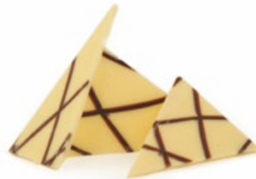
Carrara Raggia | 55 x 35 mm | VPE: 490 St.