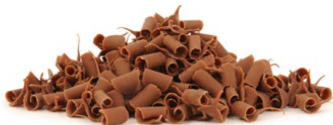
Milch | VPE: 2 kg | Art. Nr.: E0081