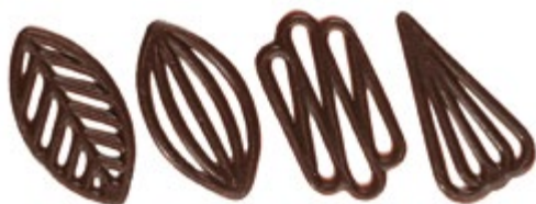
Spezial 4er Sortierung 60 mm | VPE: 600 St. | 0,650 kg Art. Nr.: E0071