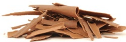
Milch | Art. Nr.: E0431