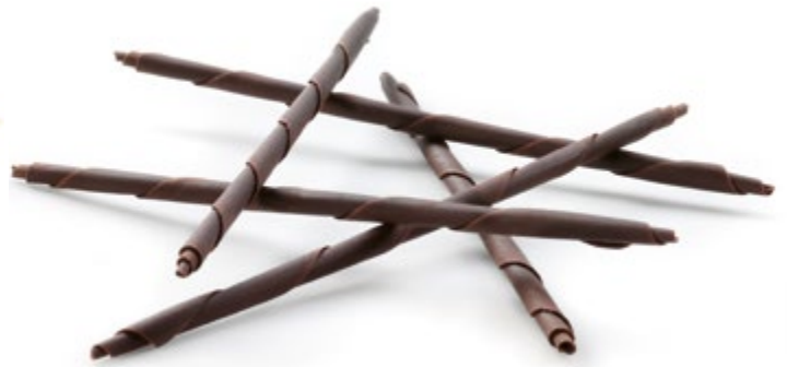
Rubens | Art. Nr.: E0272