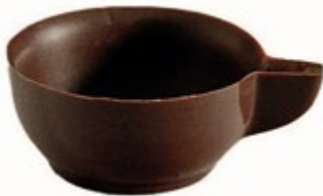
Kaffeetasse | 44 x 21 mm | VPE: 312 St. Art. Nr.: E0105