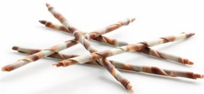
Van Gogh | Art. Nr.: E0289