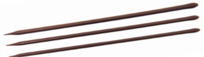
Dunkel | Art.Nr.: E1541