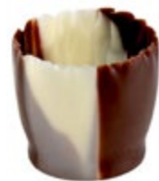
Snobinettes Duo | 27 x 26 mm | VPE: 270 St. Art. Nr.: E0310