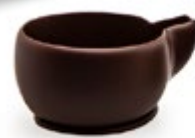
Kaffeetasse mini Zartbitter 35 x 20 mm | VPE: 120 St. Art. Nr.: E2948