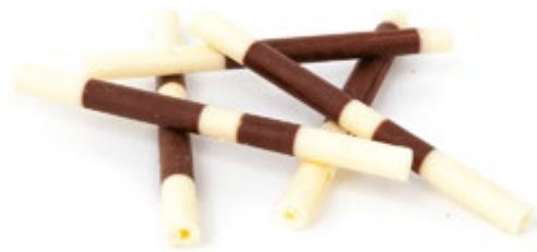
Duo | Art.Nr.: E0516