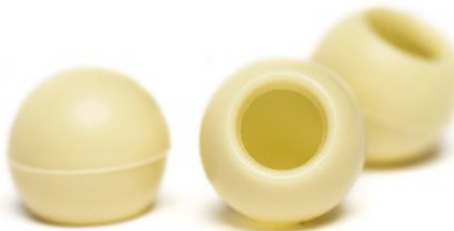
Weißer 28% Kakao Art. Nr.: CC-E1684

Verpackt in 8 Folien mit je 63 St. für die direkte Befüllung: