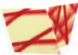
Jura Raute Rot-Weiß | 45 x 30 mm | VPE: 400 St.