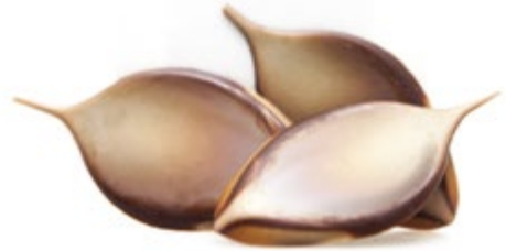
Marmoriert | VPE: 0,5 kg (ca. 333 St.) | Art. Nr.: E1547