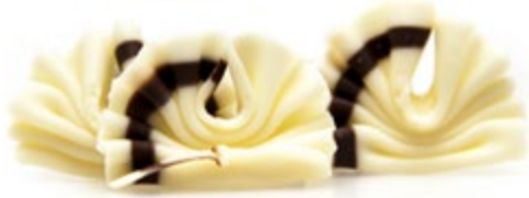
Weiß | VPE: 0,35 kg (ca. 185 St.) | Art. Nr.: E1553