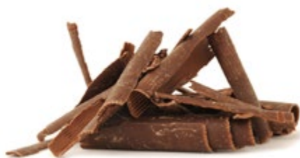
Dunkel | Art. Nr.: E0406