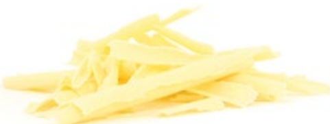
Weiß | Art. Nr.: E0448