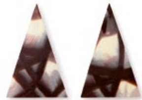
Dreieck | 35 x 55 mm | VPE: 490 St.