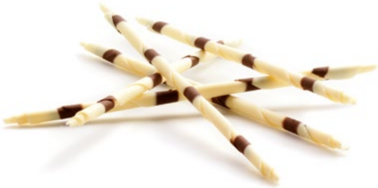
Picasso | Art. Nr.: E0286

VPE: 120 St. Größe: 20 cm Gewicht: 0,9 kg