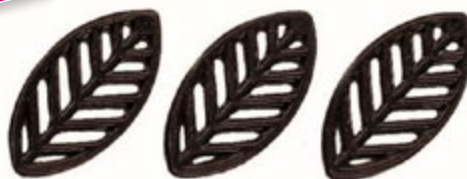
Blätter Zartbitter 60 mm | VPE: 550 St. | 0,725 kg Art. Nr.: E1188