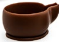
Kaffeetasse mini Milch 35 x 20 mm | VPE: 120 St. Art. Nr.: O-02791