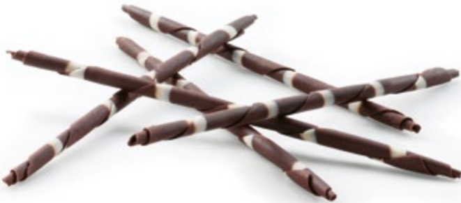
Rembrandt | Art. Nr.: E0288