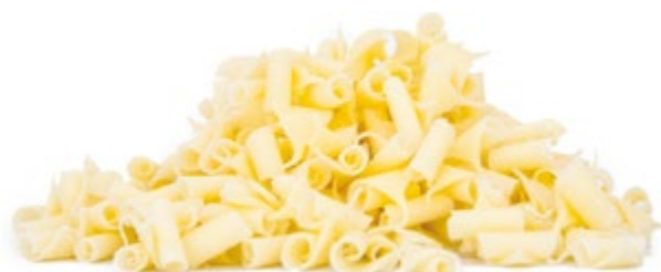
Weiß | VPE: 2 kg | Art. Nr.: E0169